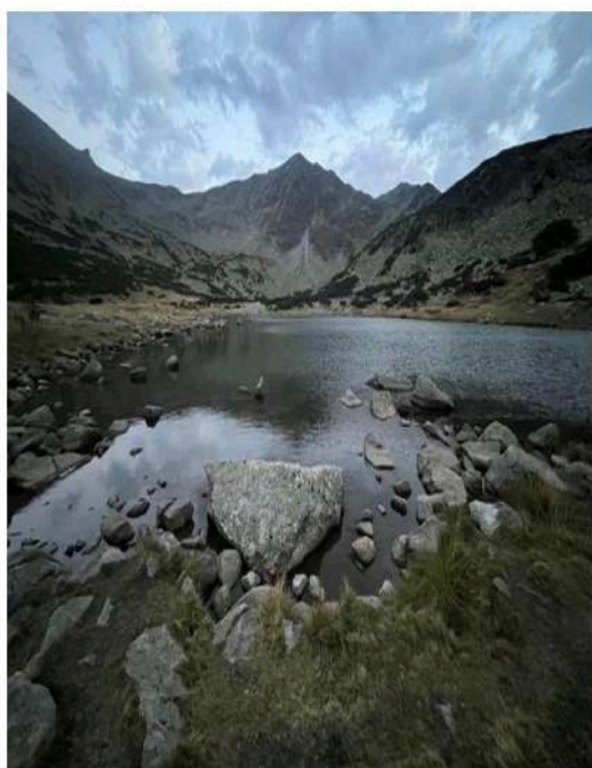
Алекси Иванов - студент и бивш възпитаник на ПГСС