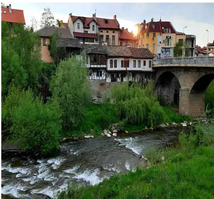
Десислава Пламенова 11.б клас