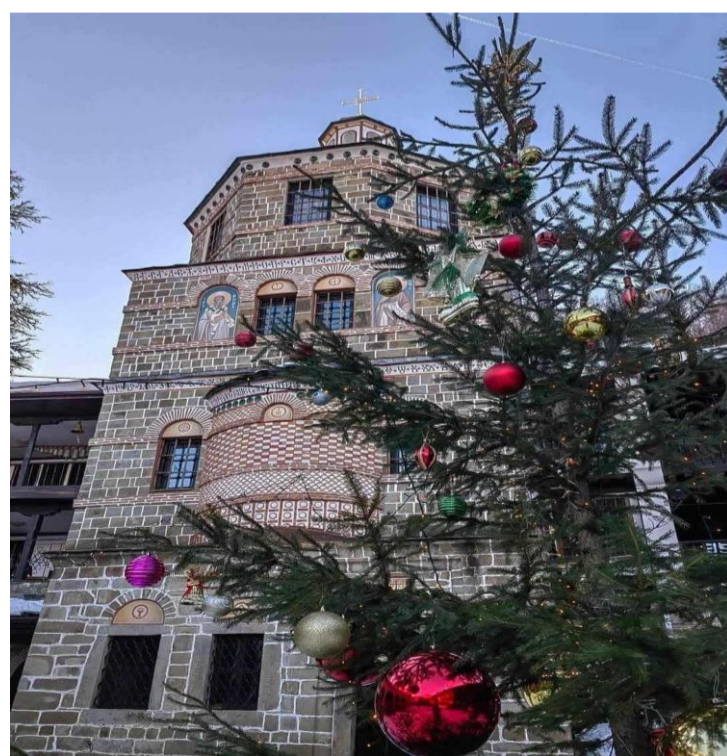
Десислава Пламенова 11.б клас