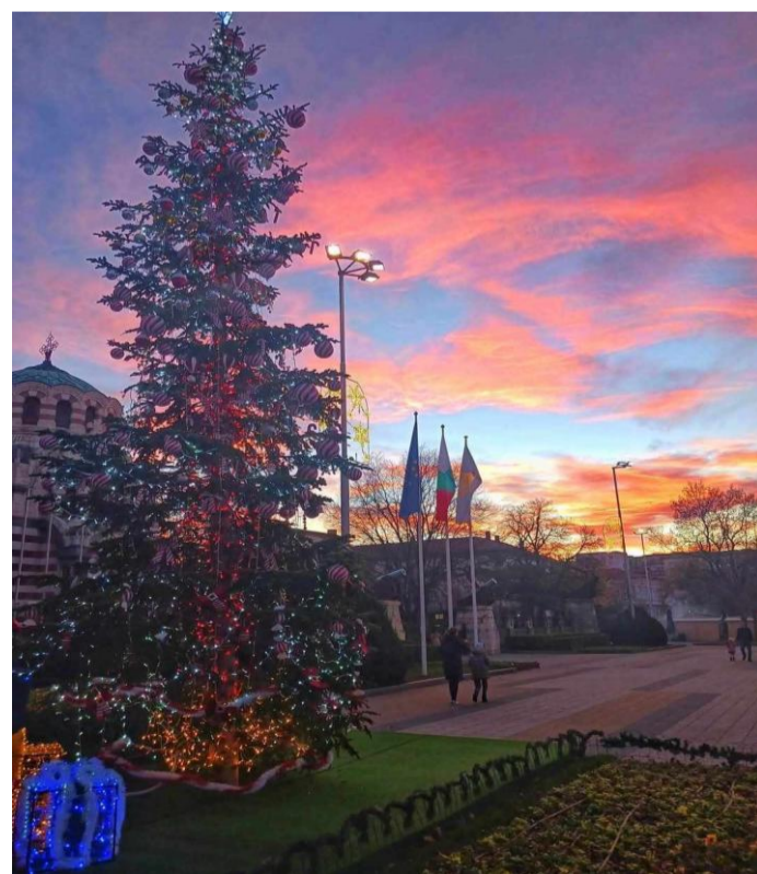
Десислава Пламенова 11.б клас