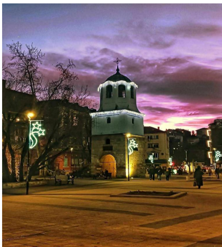
Десислава Пламенова 11.б клас