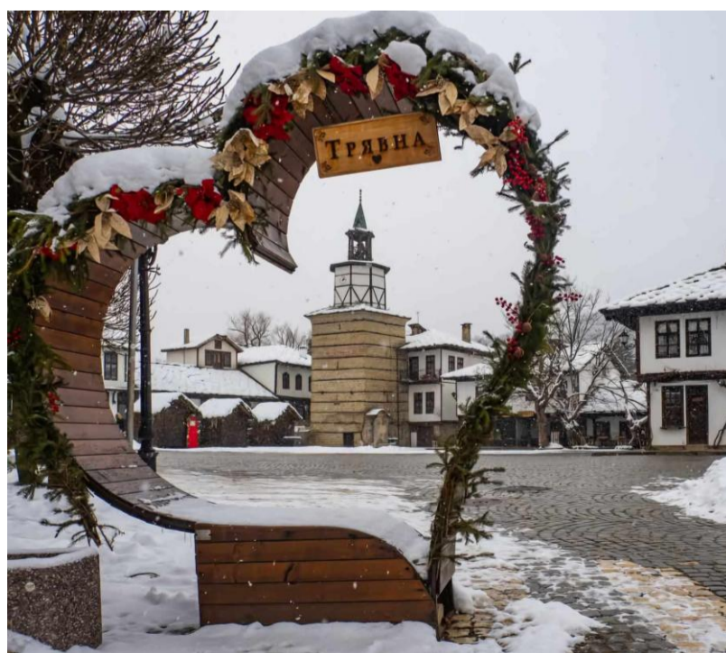
Десислава Пламенова 11.б клас