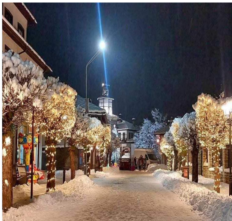
Десислава Пламенова 11.б клас